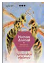
Sprievodca výstavou Human Animal III. Zmiz hmyz! 0,50 €