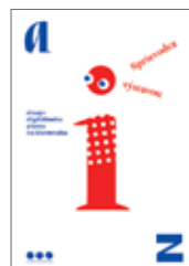
Sprievodca výstavou A-Z Dizajn digitálneho písma na Slovensku 1 €