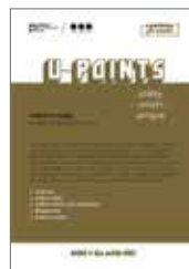
Mapa U-POINTS 1,50 €