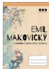
Sprievodca výstavou Emil Makovický v kresbe 1 €