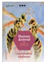
Sprievodca výstavou Human Animal III. Zmiz hmyz! 0,50 €