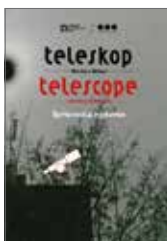
Sprievodca výstavou Teleskop Zbierka v dialógu 1 €