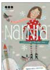
Sprievodca výstavou Narnia 1 €