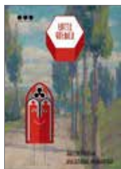
Sprievodca výstavou Terra Gothica 1 €