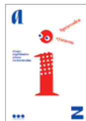
Sprievodca výstavou A-Z Dizajn digitálneho písma na Slovensku 1 €