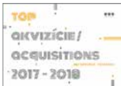
Sprievodca výstavou Top akvizície 2017 - 2018 1 €