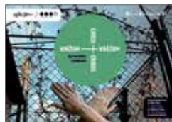
Sprievodca výstavou Krížom Krážom 1 €