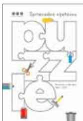
Sprievodca výstavou Puzzle 1 €