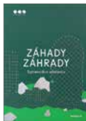
Sprievodca výstavou Záhady Záhrady 0,50 €