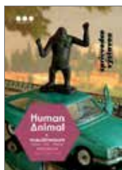
Sprievodca výstavou Human Animal I. Najbližší príbuzní 1 €