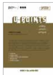
Mapa U-POINTS 1,50 €