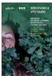
Sprievodca výstavou Niekolko zelených záznamov nadrozmernej čiernej skrinky 1 €